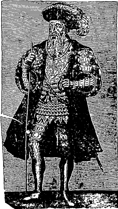
मास्की दिग्गामा ।

और कुछ कमचारी भेजे । पुर्तगीजोंने सबोंके नाक कान काट डाले और पाव बाध कर खूब अत्याचार किये ।